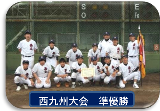
西九州大会 準優勝