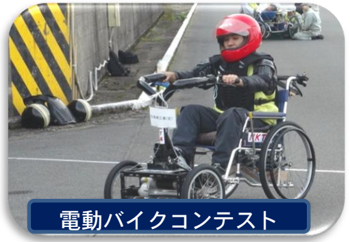
電動バイクコンテスト